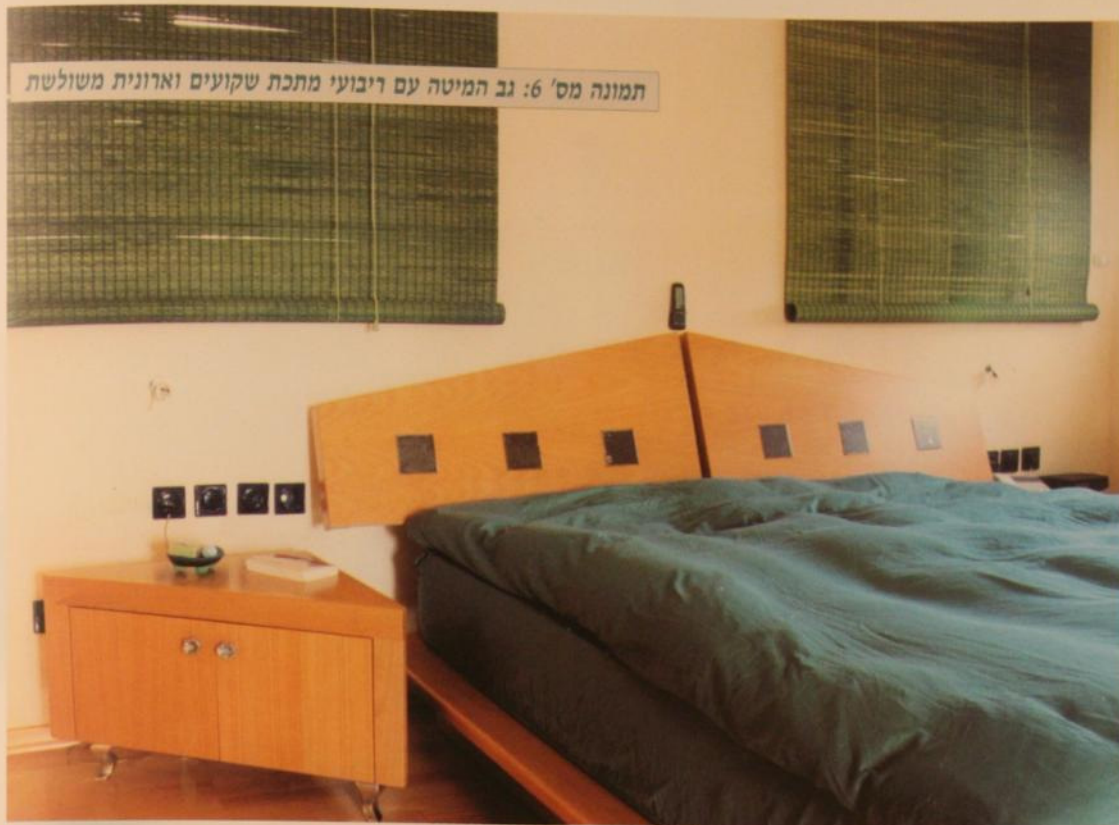
תמונה מס' 6: גב המיטה עם ריבועי מתכת שקועים וארונית משולשת