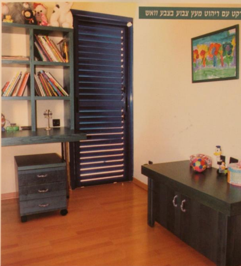
תמונה מס' 7: חדר הילדים מחופה בפרקט עם ריהוט מעץ צבוע בצבע וואש

המיטה הועמדו שתי ארונות בצורת משולש. בפינה נוספת בחדר תוכננו "שולחן איפור" בעל קו מעוגל ומדמי ספרים - גם הם מעץ צבוע בצבע וואש.