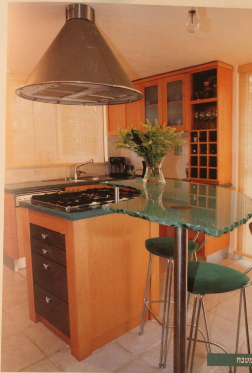
תמונה מס' 1: אי הבישול במטבח

גישה זו יצרה בית מיוחד מבחינת עיצובו הפנימי, בעל אווירה חדשנית עם ריהוט מעוצב ומקורי, ועם שילוב של חומרים לא שגרתיים. בולט מאוד השימוש בחומרים "אמיתיים" ו"טבעיים": עץ מלא, במבוק, אבן טבעית, מתכת רקועה וכדומה. העיצוב נקי ומדויק, וגם כשמופיעים עיבודים גסים – כגון בשיש ובזכוכית – הם עשויים בצורה עדינה יחסית, כדי לא לפגוע באווירה הנקייה.