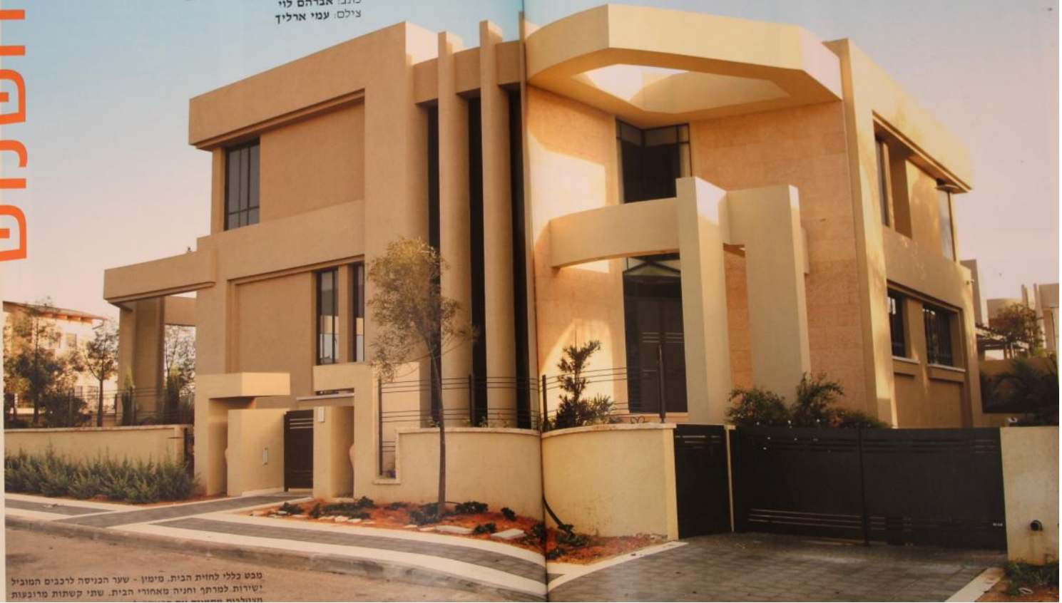
מבט כללי לחזית הבית. מימין - שער הכניסה לרכבים הטוביל ישירות למרתף וחניה מאחורי הבית. שתי קשתות מרובעות מעצמות את המבט על החצר האחורית.

אדריכלות: אדרי' נאורה גולדברג עיצוב פנים: אדרי' מיכל יפתח רותם כתב: אברהם לוי