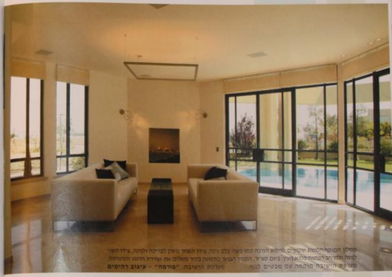
הסלון המוקף הריהוט שקיבלים מלוא הנוחה כמו מניין כלל בית, גינת האחוץ נושא למיניה ולמטה, גינת הפני לטעה ולמרה להשתחו לראת העין, כיום סטוד, הקמפין הבער כהוסנה בקיר משלים את אופיית הרצוג העיצובית מערכת הישיבה מוקמת עם מבטים לטען מערכת הישיבה "מרמה" - עיצוב רהיטים