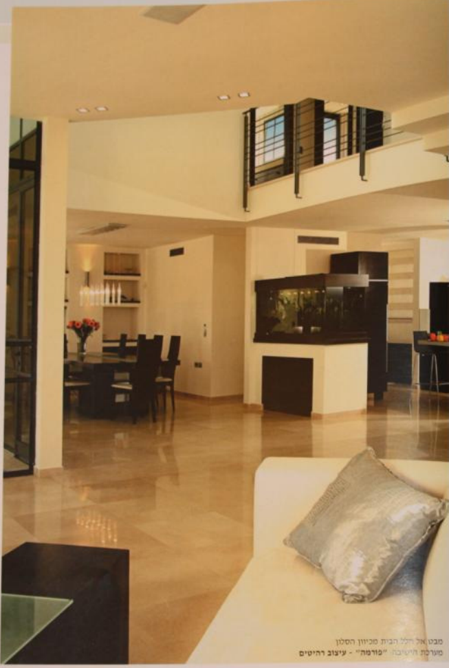
מבט אל חלל הבית מכיוון הסלון מערכת הישיבה "מרמה" - עיצוב רהיטים

מסלול קמפין באלכסון, זו סלון, שתי סמות בנוון לבן שבור "מרמה רהיטים" ויצרת מרצד סימטרי שבמרכזו קמפין. כל ריהוט הבית כולל הסמות תוכננו ויוצרו בהוסנה מיוחדת וניכרת במרטיים ובאחידות של תפיסת הריהוט. שולחן האוכל ושולחן הסלון עוצבו מעץ אמבניה עם פס וכונית חלכית החוצה אותם לאורך. כך גם הנרות בתוך הנישית. אלמנט מיוחד בחלל הכללי הינו האקוריוס.