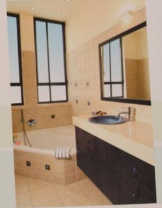
ריצוף "אבני ניצן"

המטחים בחדרי הרחצה כולם עשויים אבן גיללה לבנה הרה לריצוף. כל החיורים עליונים למעט בחדר רחצה ילדים הסיבה מרקטיות. להורים כוור מאבן ביר וית אפורה וליתר כוור ססיפס אבן גיללה. הארנוות מרחמים עשויים מעץ אמבניה או וונגה כהה. חיפוי הקירות מאבן או קרמיקה דמויות אבן מטחים: "אבני ניצן"