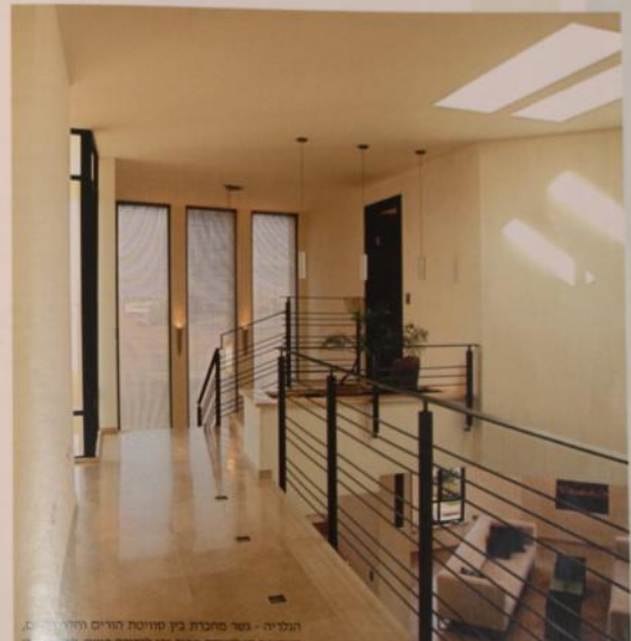
הגליה - שני מחברים בין קומות הרום והחדרים משקיפה צו לנגינת הבית ויוצר לביטוייה בגובה המדרגים מעל מדרגים אור לכל החלל. נופי תאורה המאירים את המסעים למגדלת כלה מיוחדת. הריופוף והנירוסטה

לראשי הגבר ניתנה תשומת לב מיוחדת על מנת להתאים לקונספט העיצובי, מהשלב הראשוני כתיבון העיצוב החלט על שימוש מסוי בגוון לבן שבור עם נגינת של נירוסטה ועץ כהה. התקפדה על לוח הגוונים, "יצרה שפה עיצובית אחידה ורעננה המסדרת אלמנטים והודו" קל המתאימים