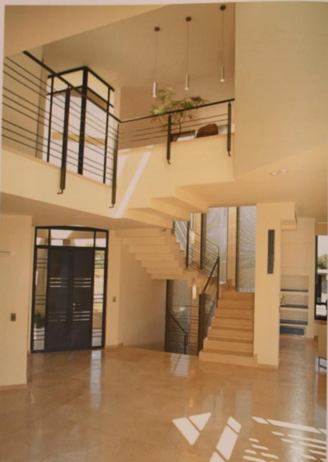
הכניסה. חלל המדרגות המוביל לשמש העליונה ולמרתף. "שמש" מסמלת פנים וארוכים המחברים בין קומות הבית. לאורך המדרגים ממוקמים מנורות תאורה המאירות את המדרגים ויוצרות צללים

לבעלי הבית. החלטתה של אדריכלות הפנים לשלב מתכת ונירוסטה נבעה מהצורך והרצון לאון את העיצוב, לשמור על סגנון מודרני-עכשווי ולמנוע את הרגשת היכבדו. שיוצר העץ הכהה. כל פרט העץ עשויים בקווים נקיים ומדויקים מעץ אמבוס מוכה משולבים וכוכית ונירוסטה. לריופוף קומת הקרקע ולחללים מתוחים בקומה אי נבחרה אבן כלה לבנה של הבית "אבני ניצן" שמיינה בקמפסת. כל נופי התאורה שנבחרו חלקם וכוכית וחלקם נירוסטה, לתקדמות מסוימות שצבבו נופי תאורה מיוחדים, כגון שני הנפיים לצדי הקפיץ בסלון השקעים, מפסקי החשמל והנירוסטה למיוון עשויים נירוסטה. לריופוף חודי השינה, נבחר סרקט בחיר המנועד לט האמבטיה הכהה השולט בבית. בחודי הרחצה נבחרה אבן בחירה "אבני ניצן". המחנות ניווד לבנים של כל דלתות הפנים העשויות עץ אמבוסיה כהה. לוח הצבעים לבן עם נגינת שחר, אמר או כסף, נשמר במטקות ובכל חללי הבית המתוחים. צבעים אחרים שולבו ברנישות ובחדרי השינה ומסבטת ילדים ←